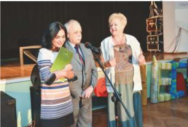
Wielkie otwarcie festiwalu